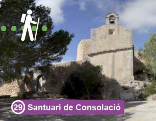
29 Santuari de Consolació