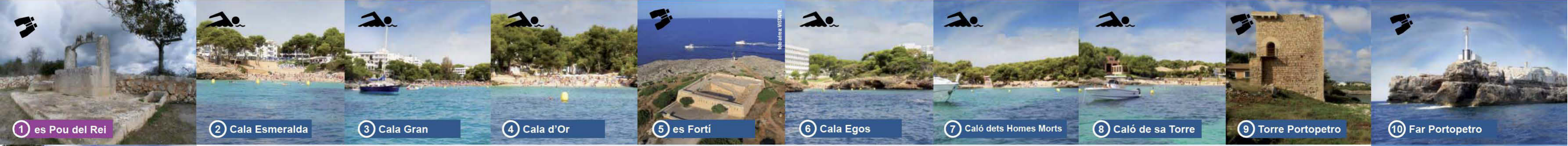
1 es Pou del Rei