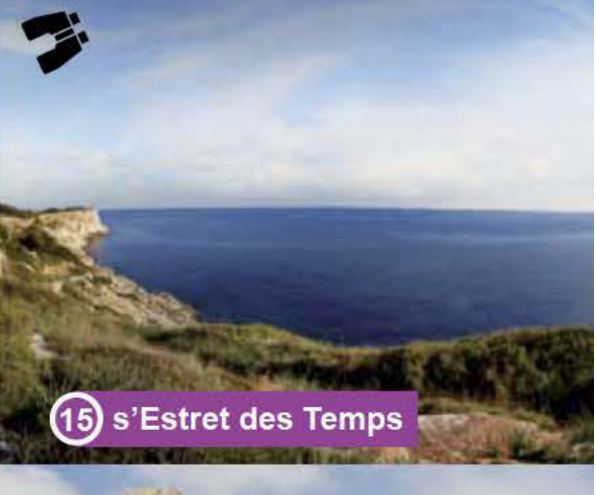
15 s'Estret des Temps