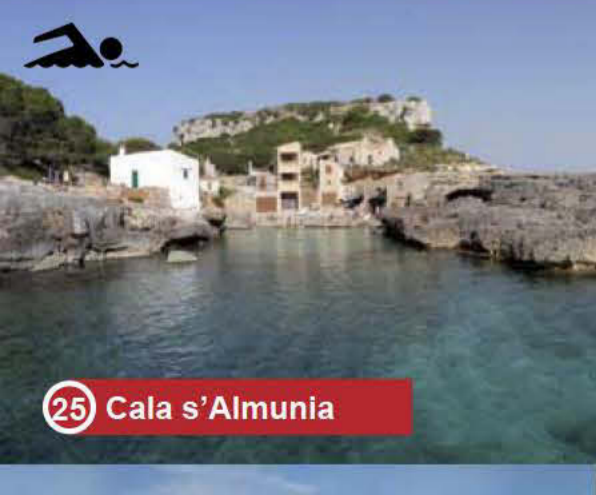
25 Cala s'Almunia