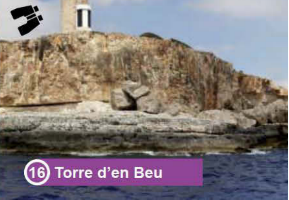
16 Torre d'en Beu