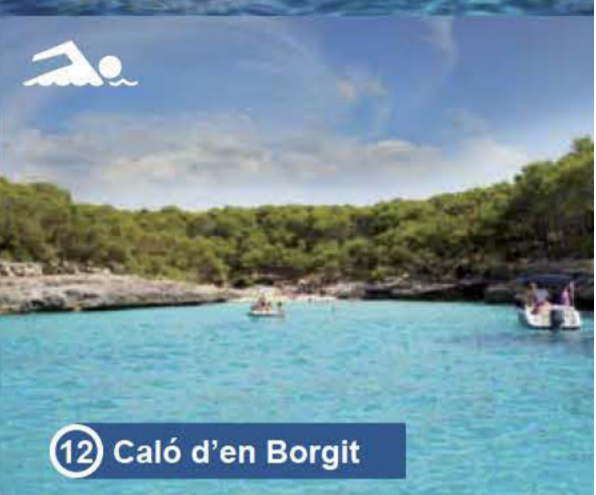
12 Caló d'en Borgit