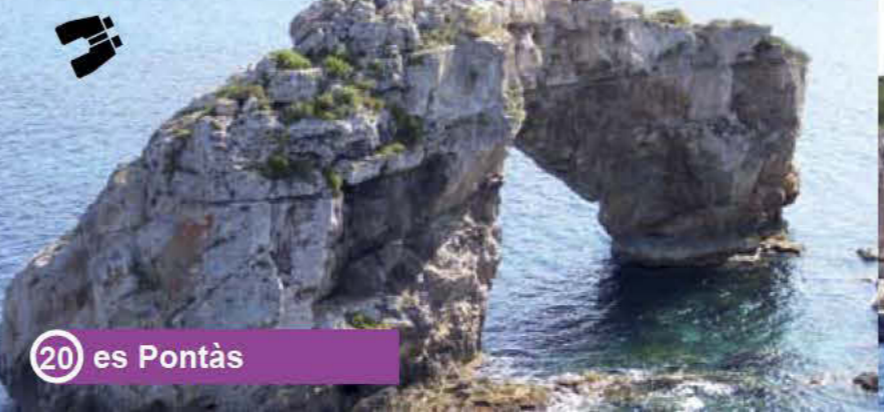
20 es Pontàs