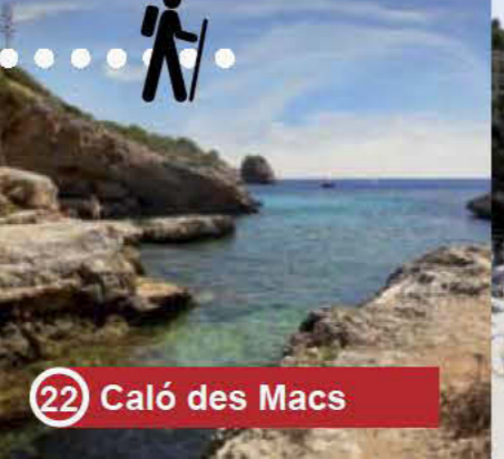
22 Caló des Macs