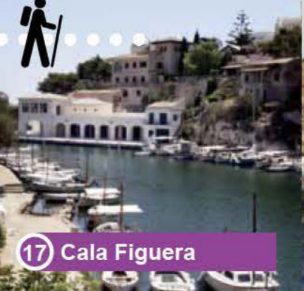
17 Cala Figuera