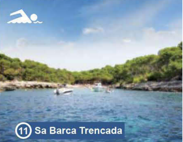
11 Sa Barca Trencada