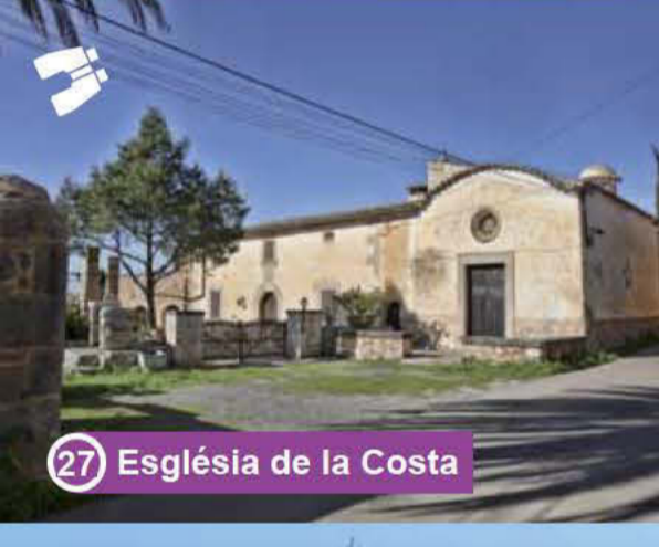
27 Església de la Costa