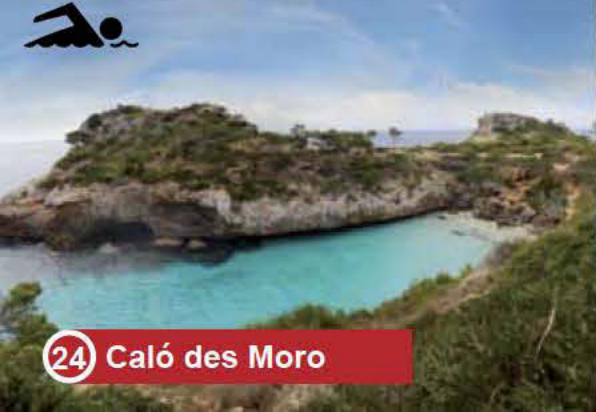
24 Caló des Moro