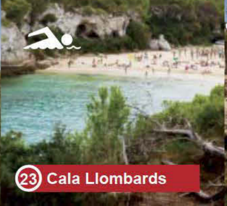
23 Cala Llobards