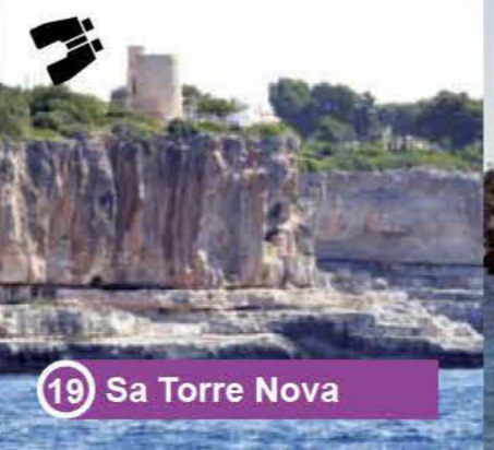
19 Sa Torre Nova