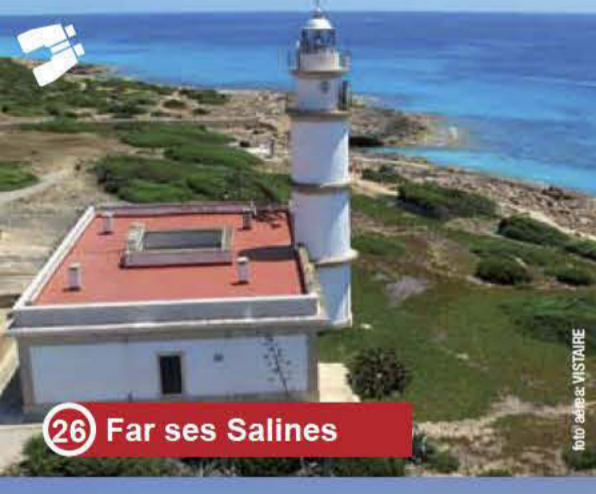
26 Far ses Salines