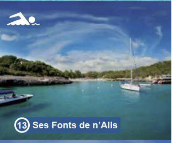
13 Ses Fonts de n'Alis