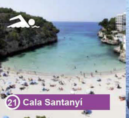
21 Cala Santanyi